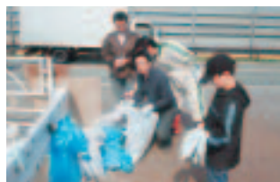
4月19日(日) 国道13号クリーンアップ