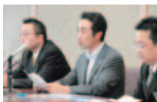
7月27日(月) 公開討論会記者会見