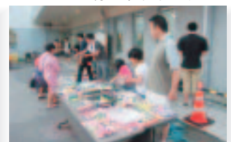
8月2日(日) すこやか横手夏祭り