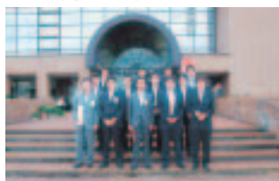
7月4日(土) ブロック大会in湯沢