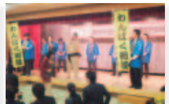
4月23日(土) 鹿角JC25周年記念