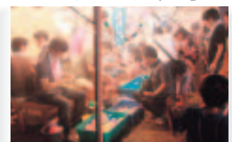
7月25日(土) 全国線香花火大会